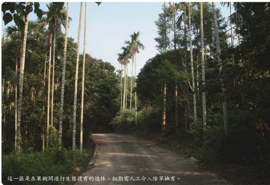
這一區是在果樹間進行生態復育的造林，初期需人工介入除草撫育。

陳玉峰教授乃經耆老之口訪，鄰近區域植被調查、考據研究等方法，了解該區未破壞前的原始植被，由其組成與環境，推估演替及相對穩定社會的大致情況，從而設計植栽，據以執行。在尊重自然本身復育能力之前提下，促進演替發生(例如種源)，縮短演替時間。此即陳教授所說之「生態綠化—人工復育天然林之方法」。