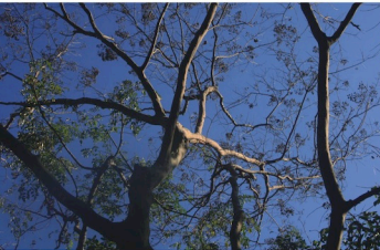
保育區內的九芎與台灣欒樹。