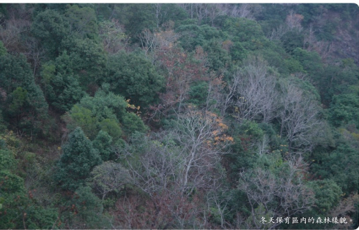
冬天保育區內的森林樣貌。