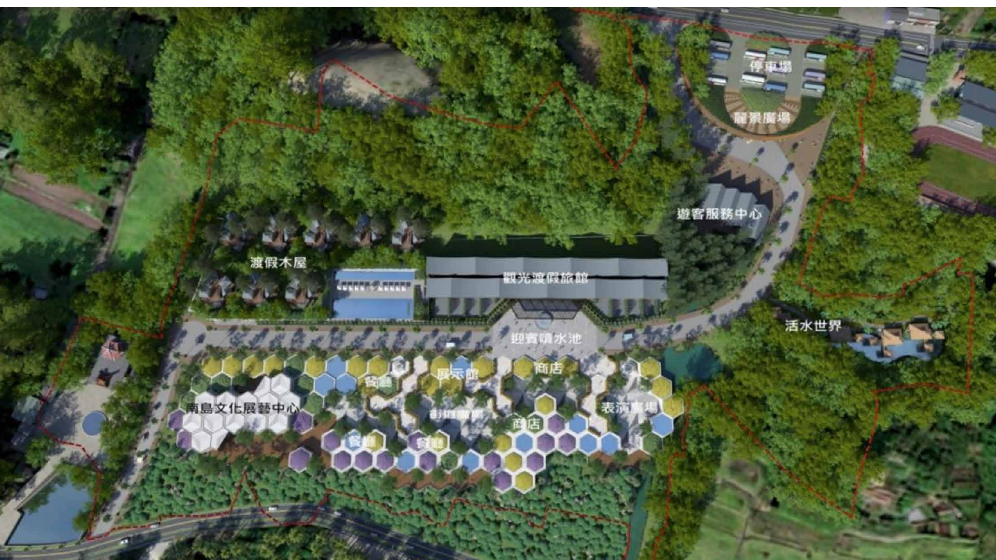
滿地富開發案園區示意圖